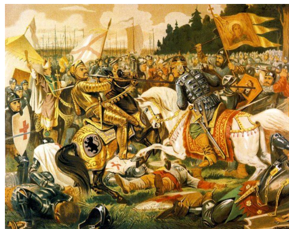
Рис. 2. Кившенко А.Д. Невская битва. Святой Александр Невский наносит рану в лицо Биргеру