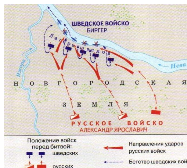
Рис. 3. Карта Невской битвы

На заре, крепкой тайной, с дружиною близился князь К Новгороду; только была им нежданная встреча: Застонал благовестник, и громкие крики раздались с веча, И по Волхову к князю молебная песнь донеслась, И в посаде встречали с цветами его новгородки —