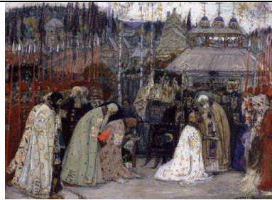
М. Нестеров. «Прощание преподобного Сергия с князем Дмитрием Донским»

Когда Нестеров узнал, что купец Павел Третьяков действительно подарил свою коллекцию картин городу Москве, то он сам принёс и подарил галерее несколько картин, включая и эскиз «Прощание Преподобного Сергия с князем Дмитрием Донским».