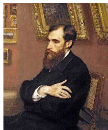
И. Репин. «Портрет П. М. Третьякова»